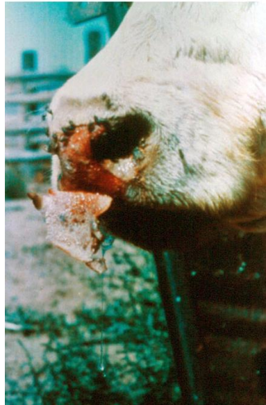
Złuszczenie zeskorupiałej śluzawicy u bydła.