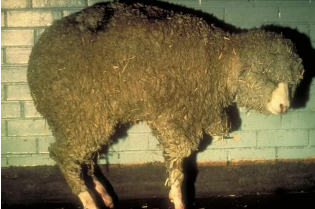
Zaawansowane objawy BTV u owcy (kulawizna spowodowana zapaleniem koronki)